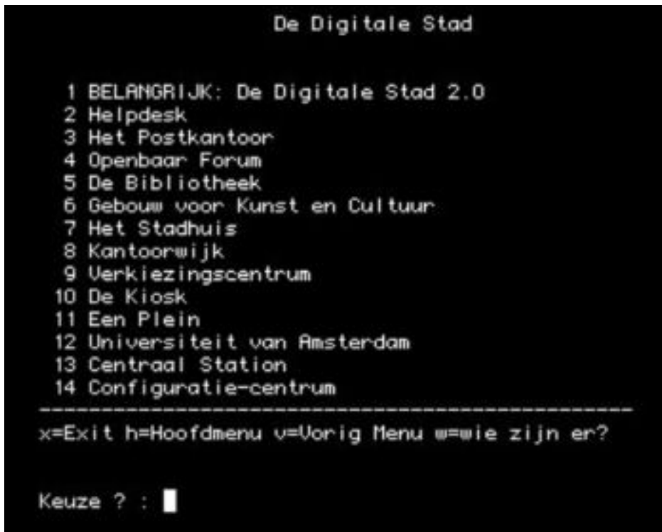
De tekst-interface van DDS