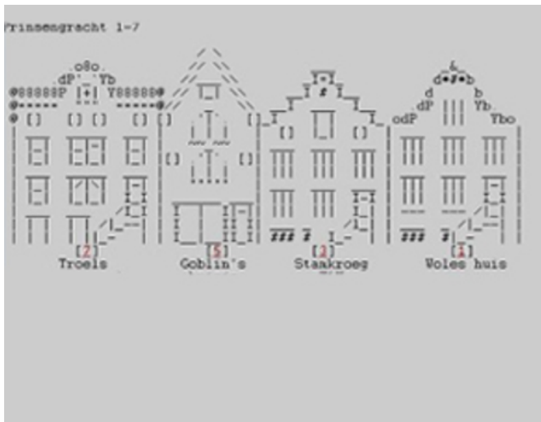
De virtuele Prinsengracht