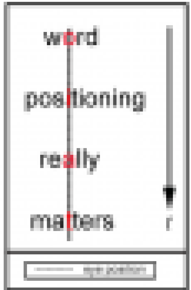
Figure 2. Spritz alignment of words

Ongeveer 20 % van de tijd besteed je al lezende aan het verwerken van de inhoud van wat je leest. De overige 80 % gaat op aan het bewegen van de ogen van woord naar woord en het scannen van de tekst op het volgende ORP. Spritz bespaart je tijd!